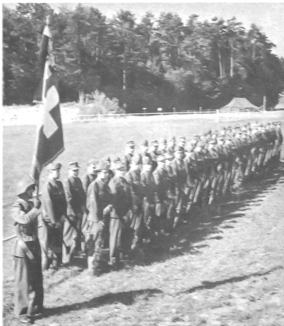
Der Unteroffiziersverein Schaffhausen trat als Probe-sektion am Mittwochvormittag als erste Sektion zur Sek-tionsübung auf dem Griesbach an.