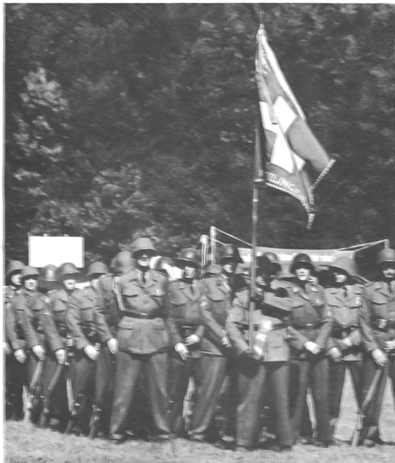
Am Mittwoch, noch bei schönem und heißem Wetter, ab-solvierte als eine der ersten Sektionen der Unteroffiziers-verein Kreuzlingen die Sektionsübung.