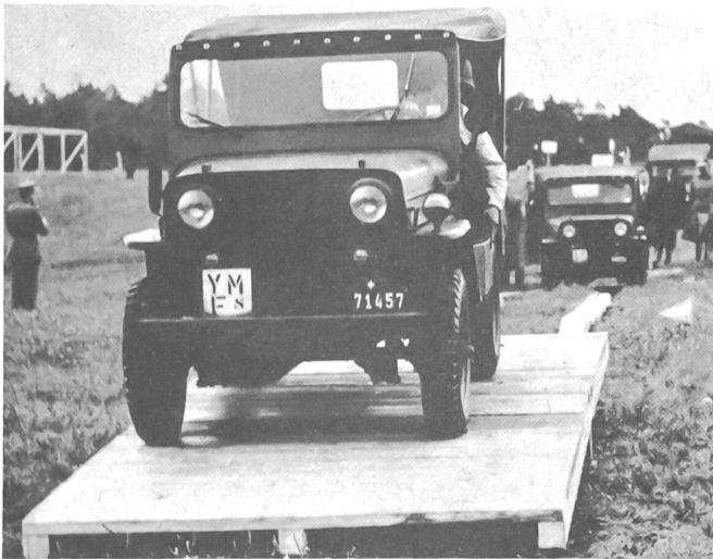
Gut angelegt, verschiedene Schwierigkeitsgrade aufweisend, war die Prüfung für die Motorfahrer.