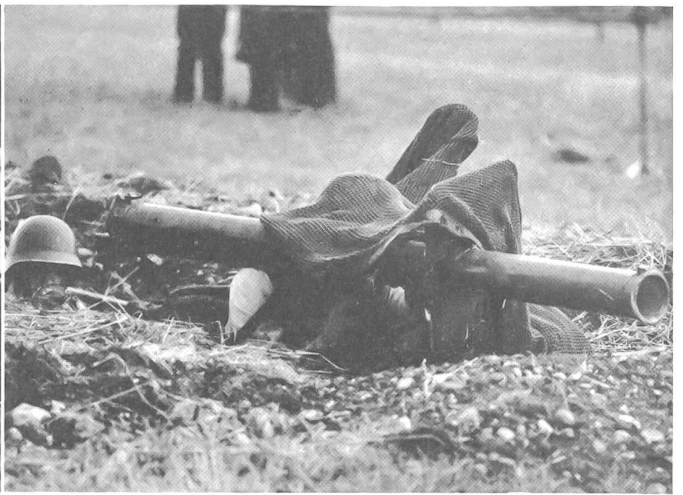
Bei der Ausbildung am Raketenrohr wurde großer Wert auf gute Tarnung und gefechtsmäßiges Verhalten gelegt.