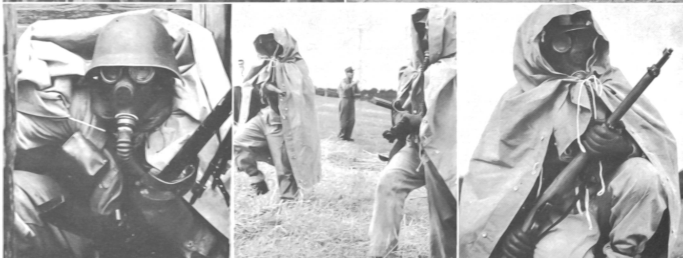
Besonderen Eindruck hinterließ die Atomübung, die zahlreichen Sektionen als Pflichtprüfung auferlegt wurde und in verschiedene Phasen zerfiel, wobei die Atomexplosion durch eine Rotrauch-Petarde und die radioaktive Strahlung durch Nebelkerzen zur Markierung kamen.