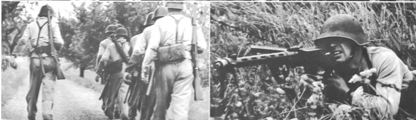
Eine interessante Prüfung war auf dem Griesbach die Angriffssübung, die vom Gruppenführer eine gute Beurteilung der Lage, eine klare Befehlsausgabe und eine sichere, das gefechtsmäßige Verhalten nicht vergessende Reaktion seiner Leute verlangte.