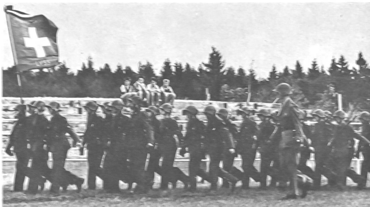
Einzug der Sektion Lyss zur Sektionsübung auf dem Griesbach.

Im Griesbach, dem Reit- und Springplatz der Schaffhauser, wurde in einem idealen Gelände die Sektionsübung durch-geführt. Im Zentrum lag vor der Tribüne der Reitplatz, auf dem sich die Sektionen mit Fahne auf zwei Glieder zu melden hatten, während ringsum, wie auf einer großen Drehbühne der Natur, die Arbeitsplätze der 15 verschiedenen Disziplinen lagen. Die Anlage, Vorbereitung und Durchführung dieser wertvollen Disziplin, die vor allem auch die Übungsleiter der Sektionen zu ihrem Recht kommen ließ, hat allgemein gefallen.