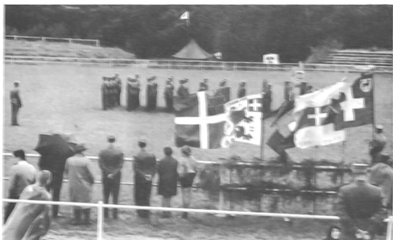
Während die Sektionen ihr Pflichtprogramm erfüllten, wurden die Fahnen vor der gedeckten Tribüne deponiert.