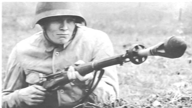
Das Schießen mit Panzer-Wurfgranaten wurde nach den Wettkampfreglemen-ten des SUOV durchgeführt.