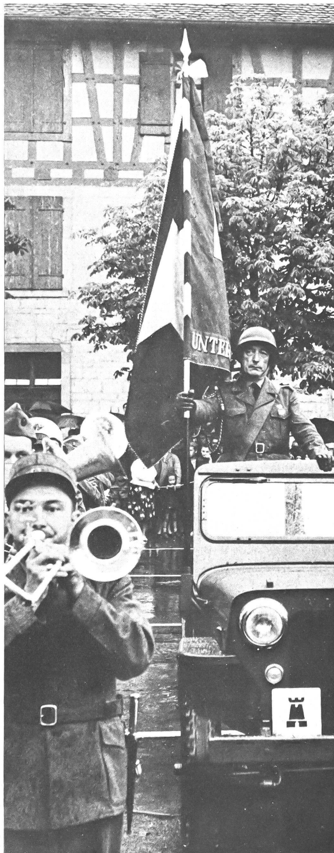
Die Zentralfahne des Schweizerischen Unteroffiziersverbandes beim Eintreffen in Schaffhausen, am Freitagabend, den 14. Juli 1961.