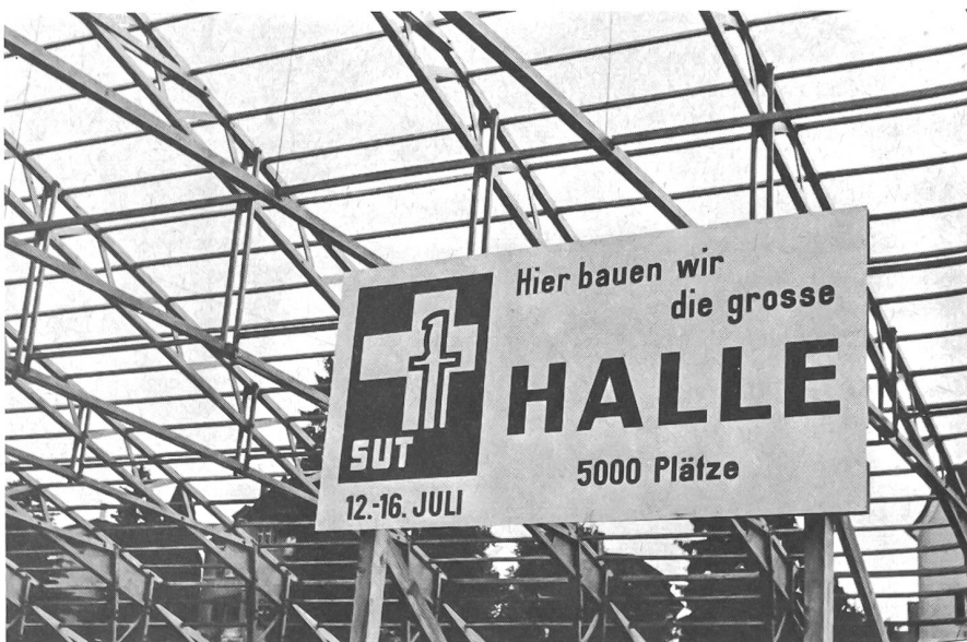
Das OK in Schaffhausen hat nichts unterlassen, um alle Möglichkeiten für eine gute und anregende Werbung für die Ehrentage der Schweizer Unteroffiziere auszunutzen. Ein gutes Beispiel für noch kommende SUT!