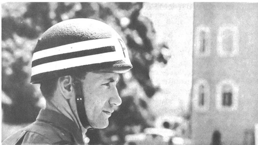
Das ist der unbekannte Soldat der Straßen-Polizei-Kompanie 24, die in der Stadt der Unteroffiziere während der SUT die Verkehrsregelung übernahm und ganze Arbeit leistete.