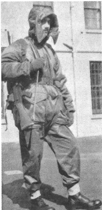
Neue und veränderte Uniformen...

der britischen Streitkräfte wurden nach einer Besichtigung durch die Königin in London der Presse vorgeführt. Insgesamt waren 21 verschiedene Uniformarten zu sehen, darunter sechs Uniformen für weibliche Angehörige der Streitkräfte. Besonderes Interesse fand der neue Winter-Kampfanzug der Infanterie (unser Bild). (key)