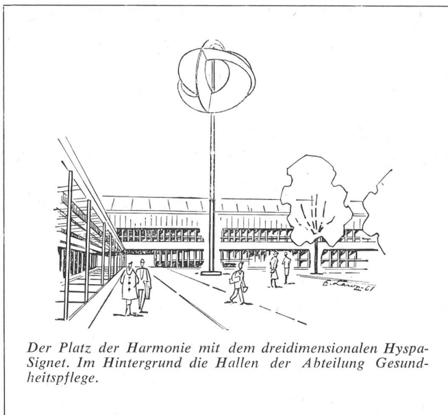
Der Platz der Harmonie mit dem dreidimensionalen Hyspa-Signet. Im Hintergrund die Hallen der Abteilung Gesundheitspflege.

dem Chef des Eidg. Militärdepartements unterstellt bis sie im Rahmen eines Zivilschutzgesetzes in ein Amt für Zivilschutz übergeführt werden kann. Ihre Aufgaben werden sich jedoch auf reine zivile Maßnahmen beschränken, indem die Obliegenheiten hinsichtlich der militärischen Luftschutztruppen auf den 1. Januar 1962 an die Abteilung für Territorialdienst und Luftschutztruppen übergehen werden.