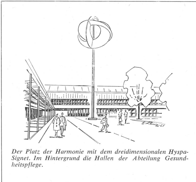
Der Platz der Harmonie mit dem dreidimensionalen Hyspa-Signet. Im Hintergrund die Hallen der Abteilung Gesundheitspflege.

dem Chef des Eidg. Militärdepartements unterstellt bis sie im Rahmen eines Zivilschutzgesetzes in ein Amt für Zivilschutz übergeführt werden kann. Ihre Aufgaben werden sich jedoch auf reine zivile Maßnahmen beschränken, indem die Obliegenheiten hinsichtlich der militärischen Luftschutztruppen auf den 1. Januar 1962 an die Abteilung für Territorialdienst und Luftschutztruppen übergehen werden.