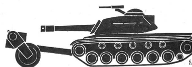
MINENRÄUMGERÄT «LARRUPING LOU»