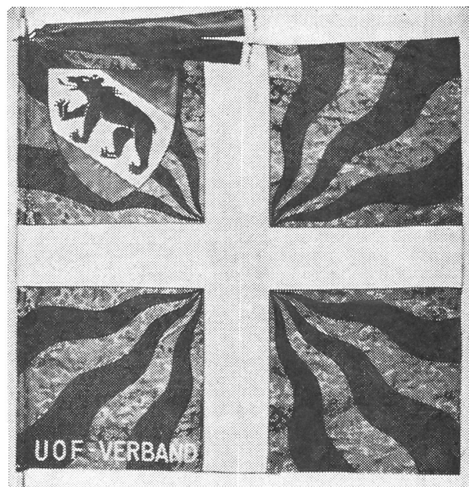
Die neue Kantonalflagge des Verbandes Bernischer Unter- offiziersvereine

Das Buch weist wiederum alle Vorzüge auf, die den beliebten englischen Autor auszeichnen: er schreibt spannend bis zur letzten Zeile, oft voller Humor, er weiß uns die Verhältnisse jener Zeit zu verge-genwärtigen und macht aus Hornblower keinen übermenschlichen Helden; er zeigt ihn vielmehr als einfachen Mann, der in ständiger Selbstüberwindung, im Kampf gegen seine innere Unsicherheit, ja oft sogar Mutlosigkeit, zum wirklichen Helden wird. V.