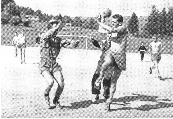
Der Handballmatch mit allen seinen erlaubten Regeln und verbotenen Tricks.

und Armhaltung, und die Offiziersschule hätte sich in ein Männerballett verwandelt. Der buntgefärbte Hintergrund in der noch wärmenden Sonne bietet ein lieblicher Dekor.