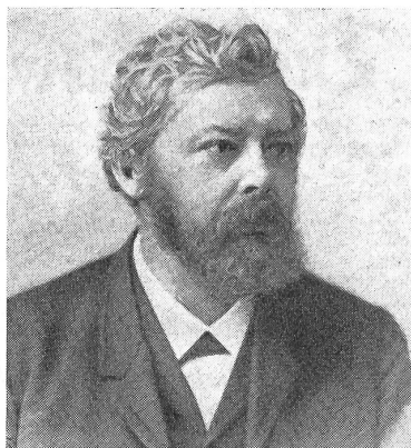
Bundesrat Ludwig Forrer