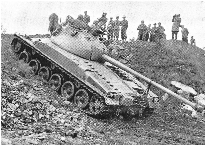
Der Schweizer Panzer 58

Das Eidgenössische Militärdepartement bot den Vertretern der Schweizer Presse Gelegenheit, an einer Demonstration auf der Thuner Allmend den von der Eidgenössischen Konstruktionswerkstätte Thun in Zusammenarbeit mit der schweizerischen Industrie geschaffenen Panzer 58 (Pz 58) kennenzulernen. Der als Prototyp fabrikationsreife Pz 58 entspricht den Hauptanforderungen, die heute an einen von unserer Armee benötigten Panzer gestellt werden müssen. Er vereinigt die stärkstmögliche Bewaffnung sowohl für die Aufgaben der Feuerunterstützung als auch für die Panzerbekämpfung mit großer Beweglichkeit und Geländegängigkeit.