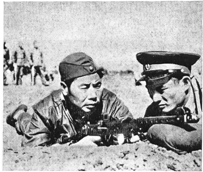
Dieser Infanterist ist ein General!

Das Oberkommando der Armee der Chinesischen Volksrepublik hat verfügt, daß inskünftig sämtliche Stabsoffiziere und höheren Truppenkommandanten während eines Monats als gewöhnliche Soldaten Dienst zu leisten haben. Ziel: «Verstärkung der Solidarität zwischen Offizieren und Soldaten!» Unser Bild zeigt links General Yang Teh-chich, Befehlshaber der Tsinan-Area in der Provinz Shantung, der von einem Zugführer am Maschinengewehr ausgebildet wird. Die britische Zeitschrift «Soldier», der wir das Bild entnommen haben, fragt sich, ob General Yang während dieses Monats den Sold eines Soldaten oder sein Generalsgehalt ausbezahlt bekommen hat.