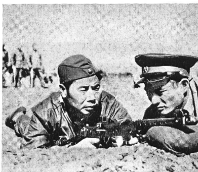
Dieser Infanterist ist ein General!

Das Oberkommando der Armee der Chinesischen Volksrepublik hat verfügt, daß inskünftig sämtliche Stabsoffiziere und höheren Truppenkommandanten während eines Monats als gewöhnliche Soldaten Dienst zu leisten haben. Ziel: «Verstärkung der Solidarität zwischen Offizieren und Soldaten!» Unser Bild zeigt links General Yang Teh-chich, Befehlshaber der Tsinan-Area in der Provinz Shantung, der von einem Zugführer am Maschinengewehr ausgebildet wird. Die britische Zeitschrift «Soldier», der wir das Bild entnommen haben, fragt sich, ob General Yang während dieses Monats den Sold eines Soldaten oder sein Generalsgehalt ausbezahlt bekommen hat.