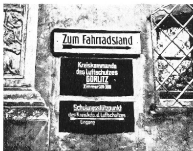
Schilder in der sowjetzonalen Stadt Götting

Während sich die Presse des Moskauer Statthalters, Ulbricht, in wilden Attacken «gegen die Atompolitik Adenauers und die Neugründung des faschistischen Reichs-