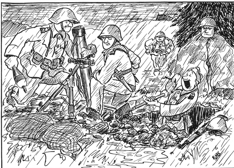
«Soldatenleebeben — hei das heißt lustig sein...!»