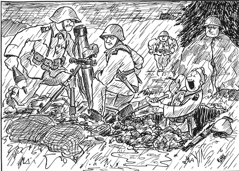
«Soldatenleben — hei das heißt lustig sein...!»