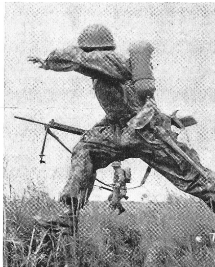
Österreichische Infanterie geht vor! Beachtenswert ist die moderne, ganz auf Tarnung ausgerichtete Ausrüstung.

Auf die Einsatzbereitschaft des Bundesheeres wird sich die Änderung in dem Sinne auswirken, daß in Zukunft ganze Brigaden voll einsatzfähig zur Verfügung stehen. Das ist gegenüber dem bisherigen Zustand, wo-