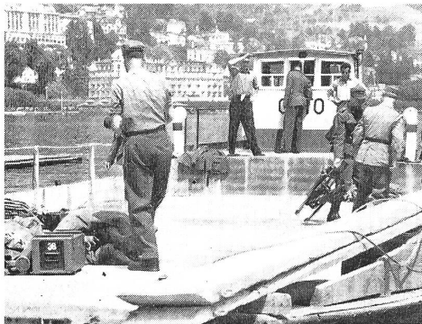
Ein Nauen als Sammelplatz.