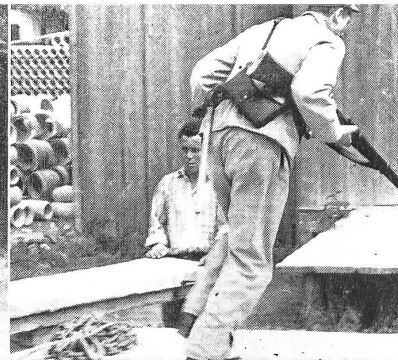
Stürmische und kampflustige Landung

im Austausch der Meinungen über das soeben Erlebte und über die neuen Aufgaben der nächsten Zeit. Hier fand auch der Humor noch seinen Platz.