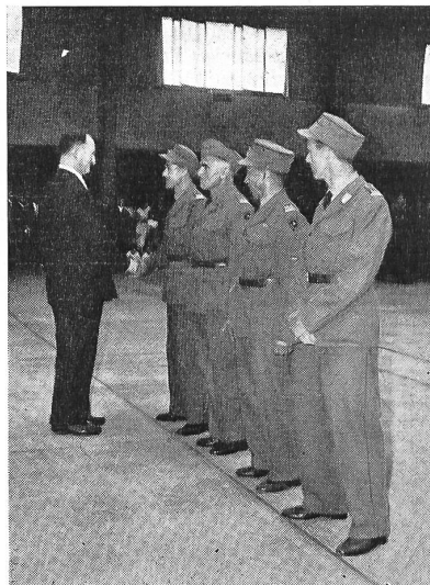
Das ist die beste Landwehr-Mannschaft, die hier vom Chef EMD zu ihrer guten Leistung beglückwünscht wird.