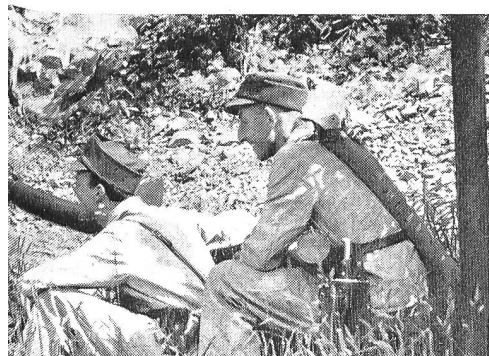
Abwehr am Allweg (Ndw.) anders als 1798

Nach der Materialabgabe, welche beim Scheinwerferlicht der Jeeps vor sich gehen mußte, saß man noch eine Weile beisammen,