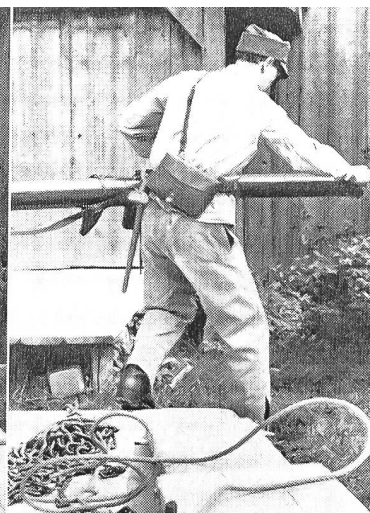
Mit allem drauflos!