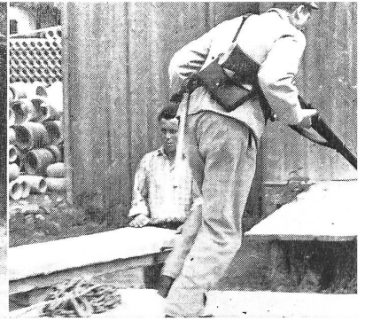
Stürmische und kampflustige Landung

im Austausch der Meinungen über das soeben Erlebte und über die neuen Aufgaben der nächsten Zeit. Hier fand auch der Humor noch seinen Platz.