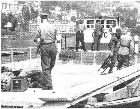
Ein Nauen als Sammelplatz.