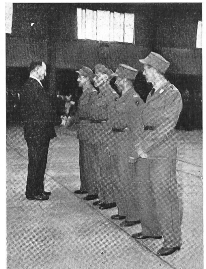
Das ist die beste Landwehr-Mannschaft, die hier vom Chef EMD zu ihrer guten Leistung beglückwünscht wird.