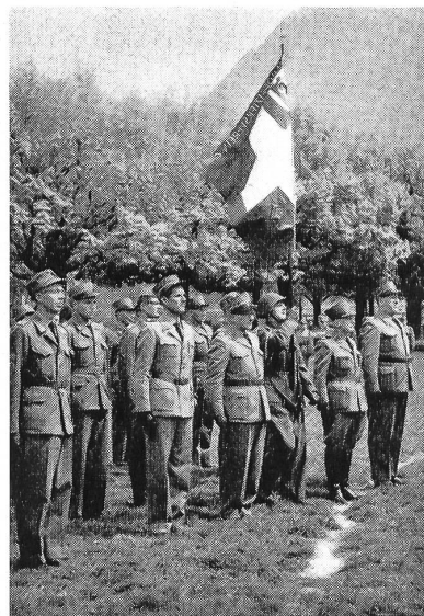
Unteroffiziersverein Chur mit der neuen Fahne

zwei kurze Stunden der kameradschaftlichen Verbundenheit von Gästen und Delegierten zu dienen, bis dann an diesem schönen Maientag zum Aufbruch geblasen werden mußte. Die flotte Arbeit in Chur und der imponierende Gesamteindruck haben dazu beigetragen, daß die Delegierten in ihren Unterverbänden und Sektionen mit Begeisterung und Initiative wieder an die Arbeit gehen und aus diesem Erlebnis auch die Kraft und den Mut schöpfen, Schwierigkeiten und Hindernisse zu überwinden. Die nächsten Schweizerischen Unteroffizierstage in Schaffhausen sind das leuchtende Ziel, dem heute aller Einsatz dienen muß.