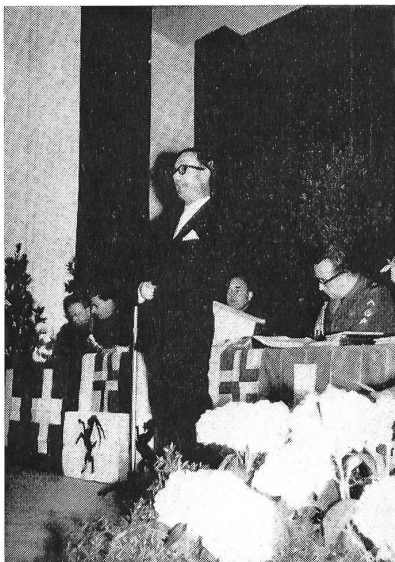
Regierungsrat Huonder spricht zu den Delegierten

Ein gemeinsames Mittagessen bildete nach der Tagungsarbeit den Schlußpunkt, um zu den Klängen der Stadtmusik noch