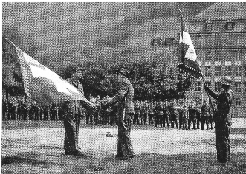
Der UOV Davos übergibt die neue Fahne dem UOV Chur

der Armee erhielten die verdiente Beachtung und Würdigung und fanden auch bei Gästen und Delegierten großen Beifall.