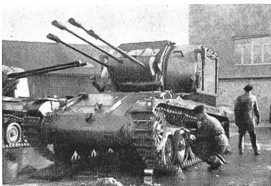
Der Flabpanzer der Firma Bührle, Oerlikon