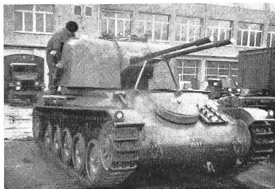
Der Flabpanzer der Firma Hispano Suiza

Auch die rasche Entwicklung der Luftabwehrrakete kann den Flabpanzer nicht verdrängen, wenn sie auch nachhaltig auf seine Gestaltung einwirken wird.