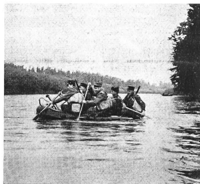
Der UOV Frauenfeld übt Flußüberquerung im Schlauchboot