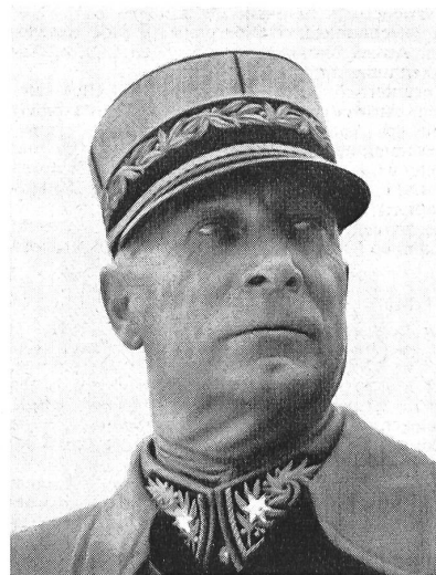
Minister Hermann Flückiger †

New look: «...jetze muesch dänn die Ränze aaluege, wo's git, wänn's iri neue Ausgangs-Huetli versorge müend!»