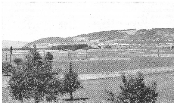
Ausblick aus dem Raume Seewagen—Kottwil in Richtung Ronnegg—Wauwil.