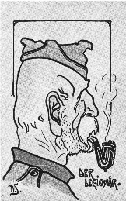
Die gute Zeit der alten Ordonnanz