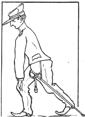
Damals ... Spinner

Kreml, Chruschtschow, den mit den Alliierten geschlossenen Vertrag über die Vier-Sektorenstadt und die Garantie der freien Zufahrten einseitig gekündigt, um eine sechsmonatige Frist zur Erreichung eines neuen, die Garanten der Freiheit Berlins, England, Frankreich und die USA mit ihren Truppen, fernhaltenden Übereinkommens zu verkünden. Gleichzeitig wittern die Marionetten Moskaus, die von russischen Truppen gestützte Regierung der sogenannten «Deutschen Demokratischen Republik» in Pankow, Morgenluft und fühlen sich bereits als Erbe des freien Teils der alten Reichshauptstadt.