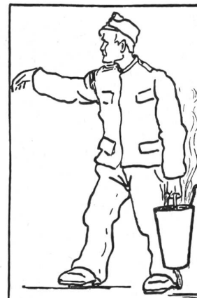
Damals ... Faßmannschaft

In der Truppschule Munster-Lager wurde die Organisation der «Feuerwehr» erprobt, die waffentechnischen Anforderungen aller Art klargestellt und die taktischen Grundelemente festgelegt. Heute darf man feststellen, daß die Grundlagen dieser Hauptsektoren weitgehend für die absehbare Zukunft festgelegt sind und die entsprechenden Konsequenzen für die Bundeswehr, soweit es die «Feuerwehr» betrifft, sind gezogen.