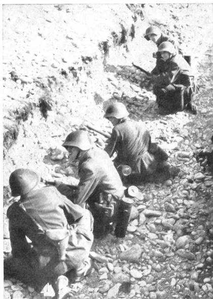
Eine Gefechtsgruppe, ausgerüstet mit vier PzWG-Garnituren, wird in Deckung vom Gruppenführer über die Aufgabe orientiert.

führer hatte seine 4 Schützen so einzusetzen, daß diese Panzer mit möglichst wenig Schüssen überfallen und getroffen wurden.