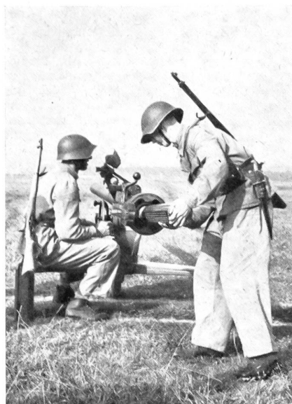
Unser Bild zeigt das Einschießen des Geschosses in die BAT.

Erstmals wurden Wehrmänner in der Handhabung und im feldmäßigen Einsatz des neuen, rückstoßfreien Panzerabwehrgeschützes Typ BAT (Provenienz: USA) ausgebildet. Das Geschütz besitzt Treffsicherheit auf 1500 bis 2000 m Distanz und wiegt rund 250 kg.