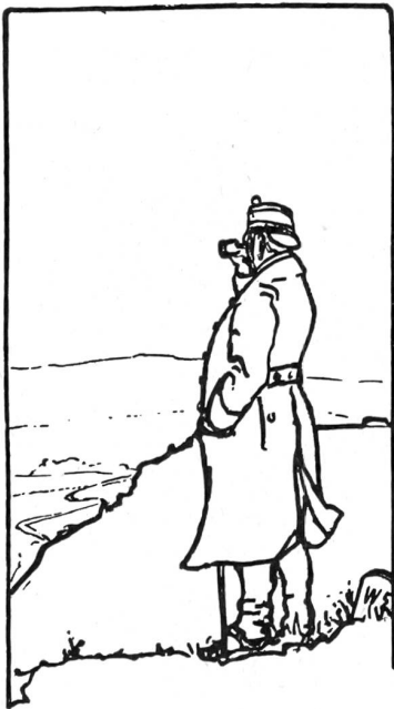
Wer unter den Veteranen unserer Leser erinnert sich nicht an diese stämmige Soldatengestalt? Unverkennbar! Oberstkorpskdt. Ulrich Wille, 1914—1918 Oberbefehlshaber der Schweizer Armee.