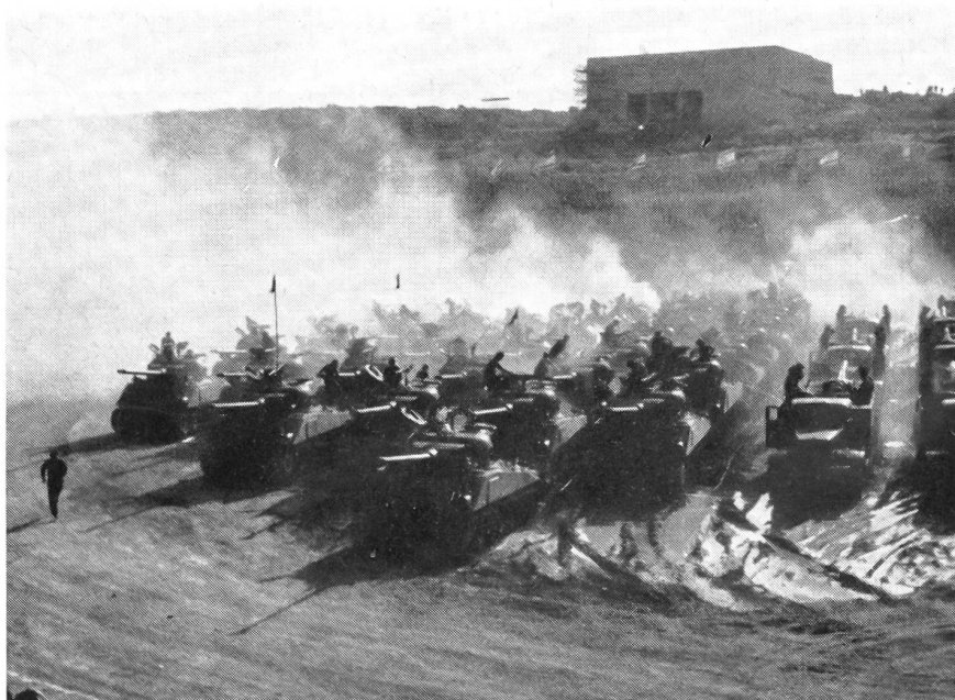
Die Panzermotoren laufen an. (Sherman)

nehmen gleichzeitig Bewachungsaufgaben und Sperraufträge. Sie sind die Wellenbrecher gegen eine Invasion, die bis zum letzten — ohne Ausweichen — gehalten werden. Die Kibbuzim erfüllen also die Aufgabe modernsten Wehrbauerntums, und es versteht sich von selbst, daß in diesen Kibbuzim alles kämpft. Mann und Frau. Sie sollen der beweglichen Armee den richtigen Einsatz ermöglichen. Die Armee wie-