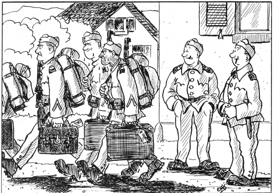
Köfferli-Türgg: «...Woane hauets-es?» «Is alt Kantonement z'rugg und dete iri Köfferli heischicke, wo bi de Dislokation uf mene Fourgon g'funde worde sind!»