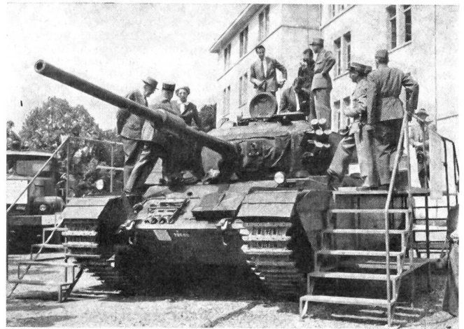
In der großen Waffenschau des EMD in Lausanne erregten die Centurion-Panzer und ihr Zubehör das besondere Interesse der