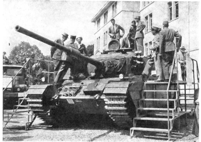
In der großen Waffenschau des EMD in Lausanne erregten die Centurion-Panzer und ihr Zubehör das besondere Interesse der