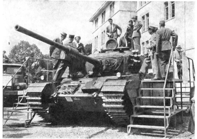
In der großen Waffenschau des EMD in Lausanne erregten die Centurion-Panzer und ihr Zubehör das besondere Interesse der