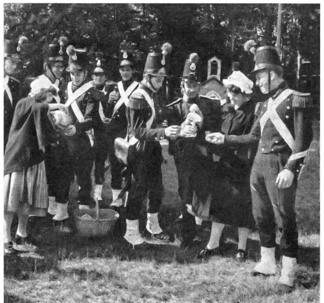
Szene aus dem Festspiel «Hundert Jahre im Dienste des Landes» zur Jahrhundertfeier des UOV Lausanne im Freilichttheater von Sauvablin.