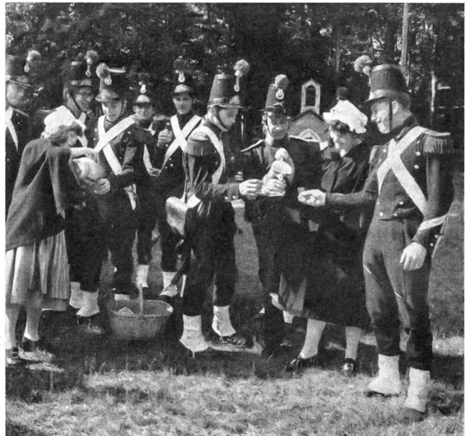
Szene aus dem Festspiel «Hundert Jahre im Dienste des Landes» zur Jahrhundertfeier des UOV Lausanne im Freilufttheater von Sauvablin.