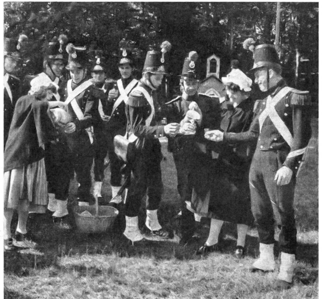
Szene aus dem Festspiel «Hundert Jahre im Dienste des Landes» zur Jahrhundertfeier des UOV Lausanne im Freilufttheater von Sauvablin.