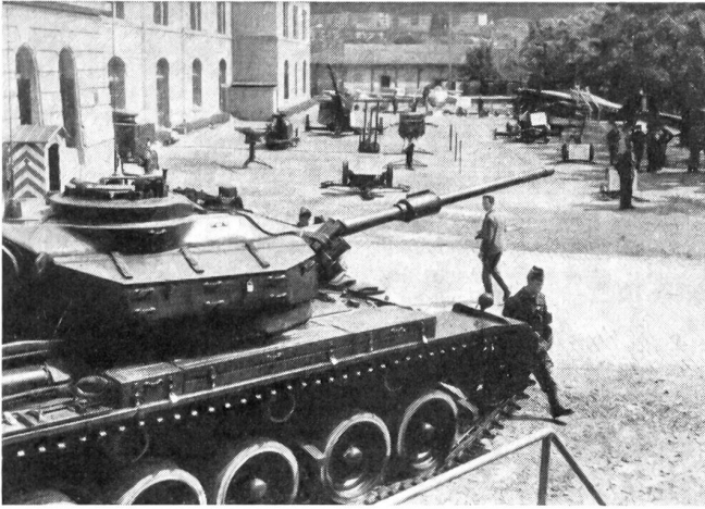
Blick in die Waffenschau vor der Kaserne Lausanne