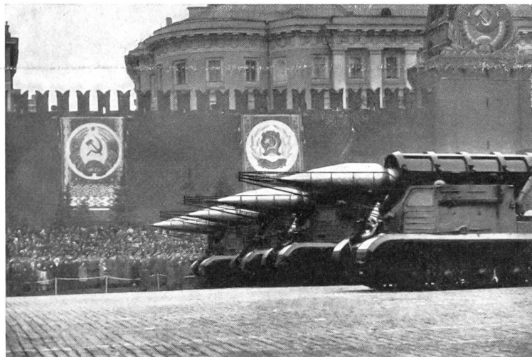
Panzerfeldraketenwerfer für un gelenkte Boden-Boden Raketen Typ 2 mit Feststofftreibsatz, Raketenlänge 9,5 m, 5000 kg Abschlußgewicht, 1200 kg Sprengstoff, aufwärts schwenkbares Mantelrohr mit Kälteschutzeinrichtung, 40 bis 50 km Reichweite, Fahrgestell des Panzer-typs JS III. (Aus dem großen Bild-Teil von «Landesverteidigung am Wendepunkt»)

Das Buch ist sachkundig und reich illustriert und gibt über die komplizierten Zusammenhänge unserer Landesverteidigung beredten Aufschluß. Für jeden interessierten Wehrmann sehr zu empfehlen . . .