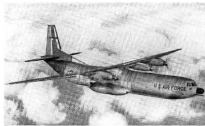
Überschalljäger F3H-2M der U.S. Navy als Träger von vier Lenkraketen «Sparrow I».

men aus der Luft bereits heute in den Generalstabskarten des Feindes eingezeichnet sind und sich bei Kriegsausbruch immer noch am gleichen Ort befinden, sind äußerst gefährdet, und es muß mit ihrer raschen Vernichtung gerechnet werden. Alle oberirdisch eingebauten oder angebrachten Anlagen (vor allem, wenn sie schon seit längerer Zeit bestehen) besitzen daher keinen eigentlichen Verteidigungswert mehr. Sie müssen deshalb entweder unterirdisch oder dort erstellt werden, wo das Gelände von Natur aus ein sehr starkes und geschütztes Bollwerk bildet, so daß ihre Zerstörung nicht ohne weiteres möglich ist. In besonderen Fällen können solche Anlagen schließlich noch dort erstellt werden, wo sie der Sicht vollständig entzogen und dem Feinde nicht bekannt sind.