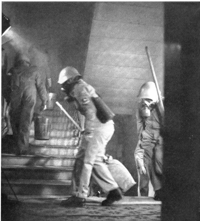
In den Hausfeuerwehren bietet sich den Frauen ein wichtiges und in der Ausbildung auch für Friedenszeiten wertvolles Betätigungsfeld. Es geht hier um die Bekämpfung der Schäden an der Quelle, um den direkten Selbstschutz für Familie und Heim.