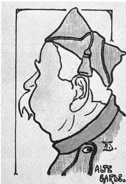
Die gute Zeit alter Ordonnanz