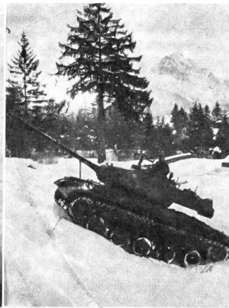
Panzer «M 41» der Gebirgsjäger