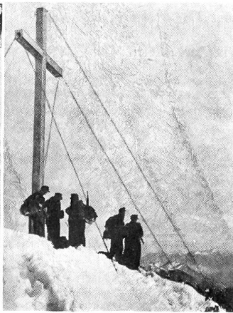
Gebirgsjäger auf dem Herzogstand