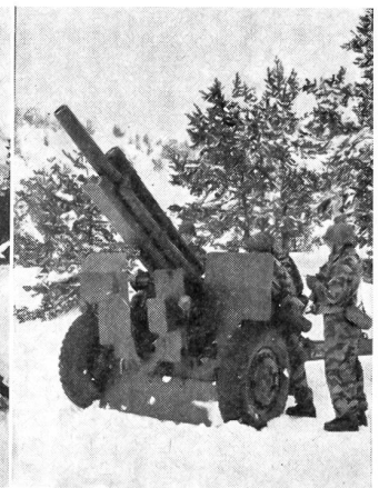
Artillerie der Gebirgsjäger in Feuerstellung