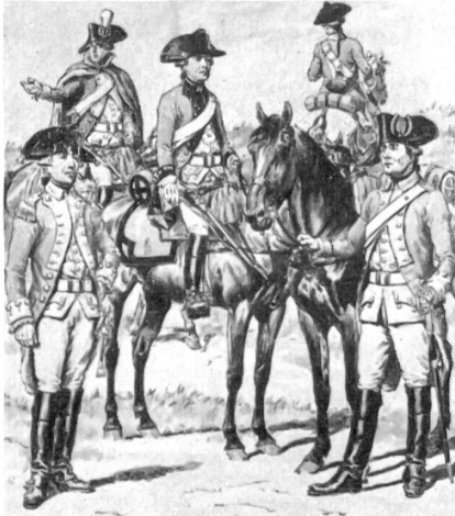
Bern 1768—1785: Dragoner.

Militärische Abzeichen sollen die uniformierte, d. h. gleichmäßig gekleidete Mannschaft voneinander unterscheiden. Je gleichmäßiger sie eingekleidet wird, desto mehr Abzeichen müssen eingeführt werden. Gewiß einigt alle das gleichfarbige Tuch; aber über kurz oder lang, sei es aus Gründen der Ueber- und Unterordnung oder der allgemein menschlichen Selbstbehauptung heraus, ist jeder Uniformierte bestrebt, durch kleine Verschiedenheiten und Abweichungen