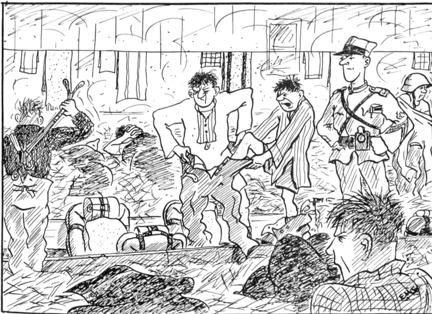
Alarm: «... Mir sind scho dummi Cheibe — 's häts natürlig wider niemert gschpanne, daß de Häuptlig geschter am Achte is Näscht isch!»