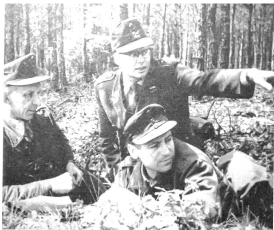
Ein Kompaniechef der Bundeswehr bei der Unterführerausstellung.