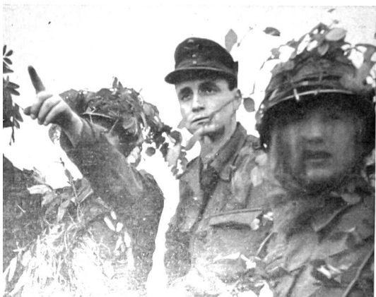
Junger Leutnant der Bundeswehr übt mit seinen Rekruten Geländebeschreibung.

und militärischen Wert abhängig ist. Es gibt kein bürgerliches, und es gibt kein Fürstenheer mehr; es gibt keine Militärkaste mehr und auch keine Leute mehr, die als Kavaliere bereits mit den Sporen an den Stiefeln auf die Welt kommen!