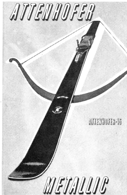
ATTENHOFER - 15 Der neue Metallski mit den unübertroffenen Fahreigenschaften