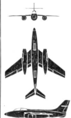
Vautour SO-4050 [(Frankreich)]