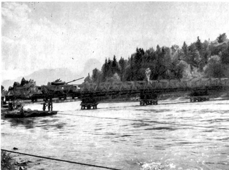
Ein Centurion erprobte die Brücke

Helmut Pabst: Der Ruf der äußersten Grenze . Tagebuch eines Frontsoldaten. 263 Seiten, Leinen DM 9.80. Verlag Franz Schlichtenmayer, Tübingen. — Man kann diesen Erlebnisbericht auch als Tagebuch eines vor dem Feinde gebliebenen Artilleristen bezeichnen. Der uns wiedergegebene Text ist eine Auswahl aus dem hinterlassenen Gesamtmanuskript des Verfassers, der unter dem Eindruck des Kampfgeschehens sein Tagebuch führte. Der Inhalt des Buches unterscheidet sich grundlegend von der heutigen Massenproduktion der Kriegsbücher, deren Verfasser leider immer wieder in ihrer Bestellerspekulation sich den «geistigen Strömungen» der Zeit anpassen und an die Sensationslust und den Sexualtrieb der breiten Masse appellieren. Die Schilderungen sind sauber, eindrucksvoll und wahr, die Mentalität des russischen Volkes richtig dargestellt. Die Sprache ist die des Frontsoldaten, eines Soldaten, der, vollbewußt der Tragik der Situation seines Volkes den Zwiespalt seiner Pflicht erkennend,