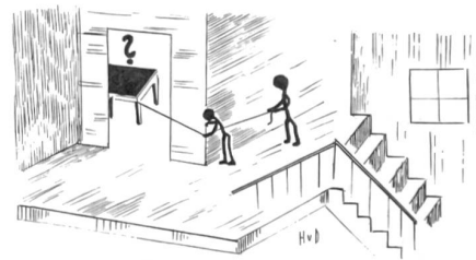
Auslösen kleiner Sprengfallen aus der Deckung heraus