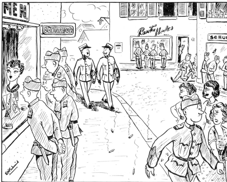
Im Ausgang: Plötzliches Interesse für Schaufenster!