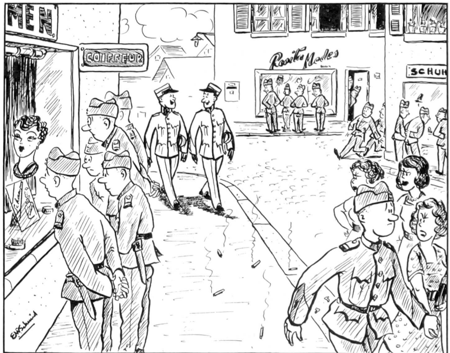
Im Ausgang: Plötzliches Interesse für Schaufenster!