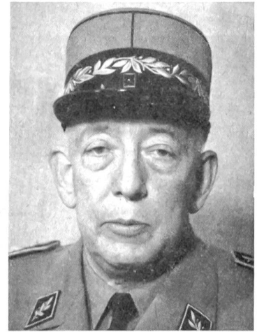
Oberstbrigadier Richard de Blonay Kommandant der Territorialzone 1

F «Gruppe Frei — durch den Wald — im Schwarm, 5 m Zwischenraum — Nr. 2, 6, 3, 7 Baumbeobachter — marsch!» (Diese Organisation kann auch in gewöhnlicher Umgangssprache besprochen werden; das Kommando löst dann die Aktion aus.)