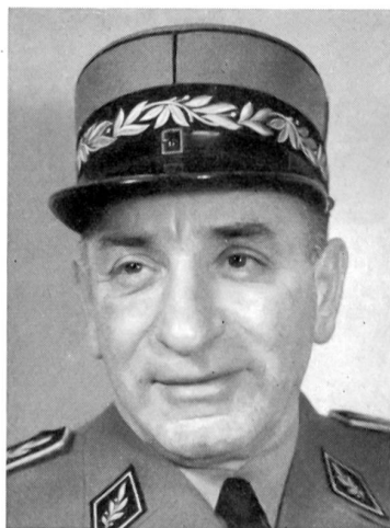
Der Kommandant der Flugplätze: