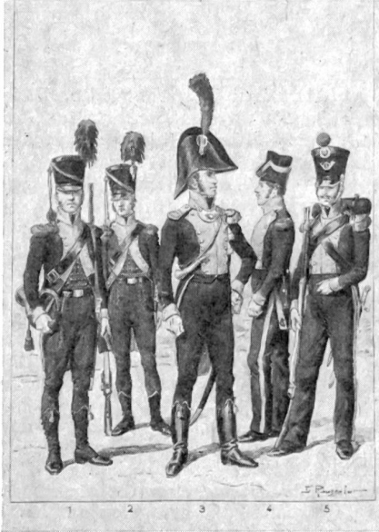
Vaud 1803—1838: Chasseurs-carabiniers. 1. Sonneur de cor, 1807; 2. Chasseur-carabinier, 1807; 3. Officier, 1813; 4. Chasseur, en bonnet de police; 5. Chasseur, 1819. (Extrait de Petitmermet et Rousselot, Uniformes des cantons suisses. Tous droits réservés.)

Die ursprüngliche Aufgabe der Schärpe, im Gefecht Freund und Feind zu unterscheiden, wurde mit der Einführung der Uniform hinfällig. Aber wie im frühen Mittelalter die Ritter die von ihrer Dame gestickte Schärpe an der Lanze, um den Helm, um den Arm oder über die Rüstung knüpften und so geschmückt ins Turnier ritten, so blieb die Schärpe noch lange das Abzeichen des höheren Standes. Sie wurde