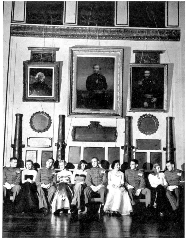
Alle Samstage ist Tanzabend mit jungen Damen aus der Umgebung. ATP