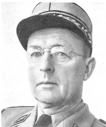
Oberstdivisionär Max Waibel Waffenchef der Infanterie

Der Waffenchef der Infanterie, Oberstdivisionär Max Waibel, wurde am 2. Mai 1901 als Bürger von Basel geboren. Er durchlief die Basler Schulen, bestand die Maturität an der dortigen Oberrealschule und studierte an den Universitäten Basel, Frankfurt a. M. und Gießen a. d. Lahn Nationalökonomie. Als Dr. rer. pol. stand Waibel vorerst einige Zeit in der Wirtschaftspraxis und trat im Sommer 1927 als Leutnant in den Instruktionsdienst der Infanterie ein.